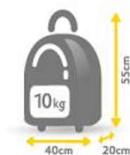
Equipaje de mano